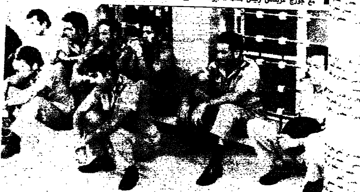
حراس القصر الجمهوري القبرصي ويبدو عليهم الحزن بعد ان توجسوا بوناة رئيسهم الطران مكاريوس